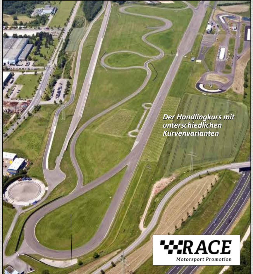
Der Handlingkurs mit unterschiedlichen Kurvenvarianten