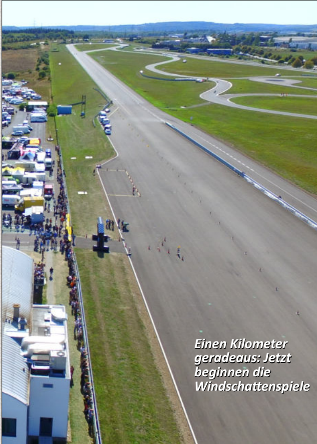
Einen Kilometer geradeaus: Jetzt beginnen die Windschattenspiele

Als Teststrecke gebaut, finden unter der Woche zahlreiche Versuche der Reifen- und Automobil-Industrie statt. Als Rennstrecke in Circuit of Luxembourg umgetauft, wird der knapp 3 Kilometer messende Kurs am langen Pfingst-Wochenende zur Rennstrecke. Bekannte Rennserien, wie IDM und Pro Superbike, fahren ebenfalls schon dort. In dieser Saison sind wieder Gastklassen Klassen am Start. Die Strecke bietet den Fahrern jede Menge Abwechslung, wie kaum eine andere Strecke. Einerseits benötigt man für die 1 Kilometer lange Gerade Leistung mit Windschattenspielen. Andererseits fordert der Streckenteil des Handlingskurses mit verschiedenartigen Kurven vom Fahrer alles ab. Freut euch auf die Abwechslung.