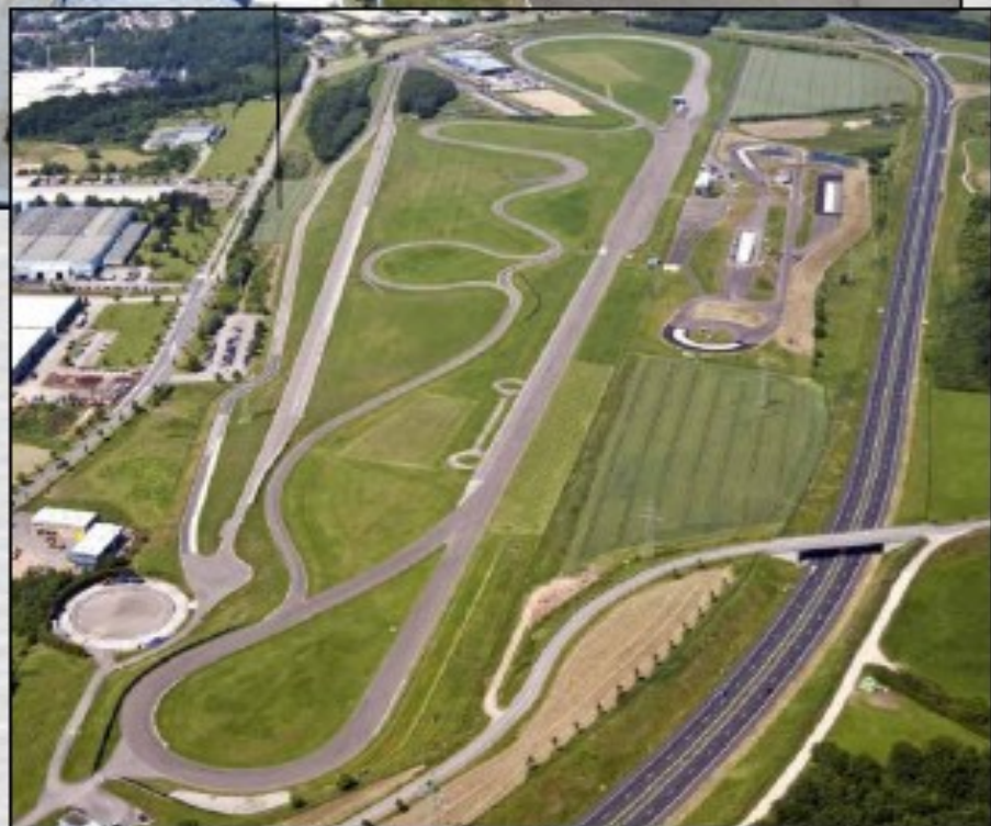
Foto rechts: Der Handlingkurs hält alle Arten von Kurven bereit bevor auf der 1 km langen Gerade die Windschattenspiele beginnen.

Foto oben: Das Verkehrs-Sicherheits-Zentrum dient großzügig als Fahrerlager und Parkplatz für Besucher.